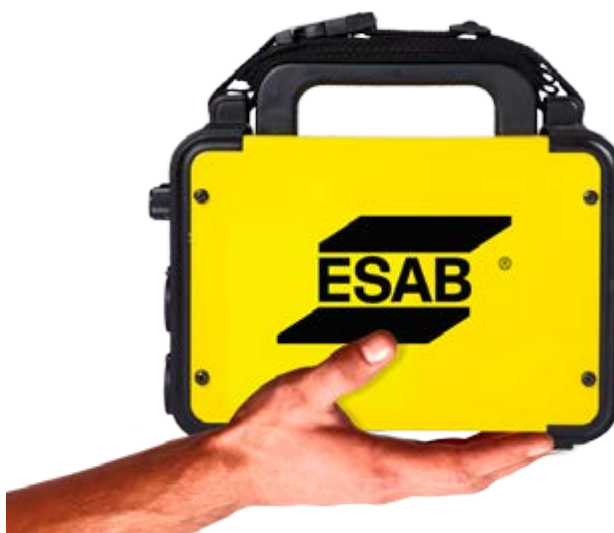
Totalmente portátil - cabe en la palma de su mano y con sólo 3kg.